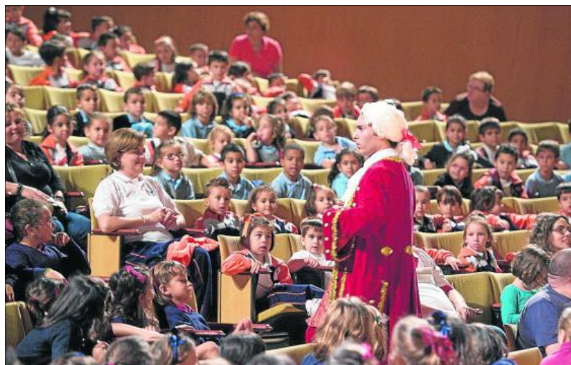
Concierto. Un momento de la actividad escolar celebrada en el Auditorio Alfredo Kraus.